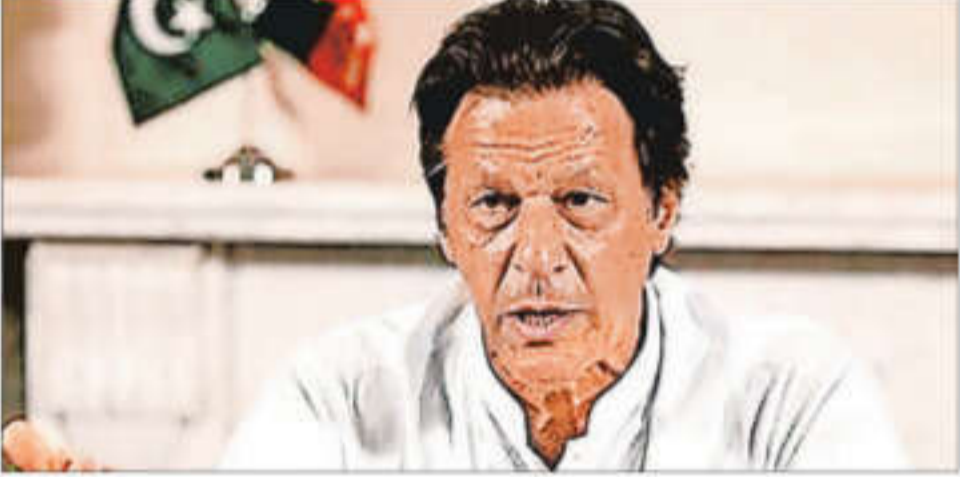
In 2023, the former Pakistan prime minister was sentenced to 14 years in prison in a corruption case

There have been reports that the 1992 World Cup-winning skipper Imran has lost approximately 85% of vision in his right eye due to medical neglect while in custody at Rawalpindi's Adiala Jail. As many as 14 former captains wrote a letter titled "Appeal by former International Cricket Captains" to the Pakistan government asking for fair treatment for Khan. "We, the undersigned former captains of